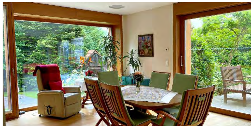
Der Altbau in der Ludwig-Kick-Straße wurde um einen Anbau ergänzt. Dort finden sich neben Aufenthaltsmöglichkeiten für die Gäste auch vier Zimmer.